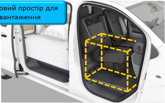
Додатковий простір для завантаження