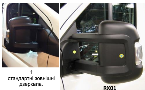
↑ стандартні зовнішні дзеркала.