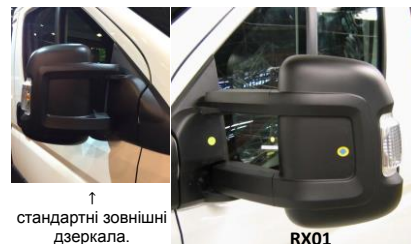
↑ стандартні зовнішні дзеркала.